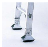
自在式滑り止め端具